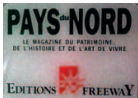
Plaque du journal, lorsqu'il était installé, de 1977 à 2000, rue de Paris à Lille.