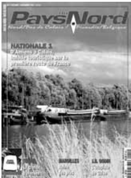
Couverture du premier numéro de Pays du Nord paru en octobre 1994.

En Auvergne, le succès de Massif Central s'était confirmé avec 3000 exemplaires par numéro ; dans la foulée, Freeway prévoyait de lancer Bourgogne Magazine et Pays de Bretagne . À Lille, ceux qui avaient lu Pays du Nord me félicitaient en disant : « C'est une bonne idée, mais ça ne marchera jamais »... Les piles de magazines ne passaient pas inaperçues dans les kiosques. Les marchands de journaux étaient furieux et disaient qu'ils avaient trop de papier. Au Conseil régional, un élu dont j'ai oublié le nom s'étonna qu'un groupe privé fasse la promotion de la région et s'interrogea sur nos ambitions politiques. Devant cet accueil mitigé, je commençais à me demander si j'avais eu raison de me lancer dans un tel projet. Puis les demandes d'abonnements se mirent à arriver. Plusieurs dizaines par jour, accompagnées de messages d'encouragement. Parmi ces soutiens : celui du comédien Fred Personne, qui hérita de l'abonnement n° 1. Désormais on pouvait dire que Pays du Nord intéressait vraiment Personne !