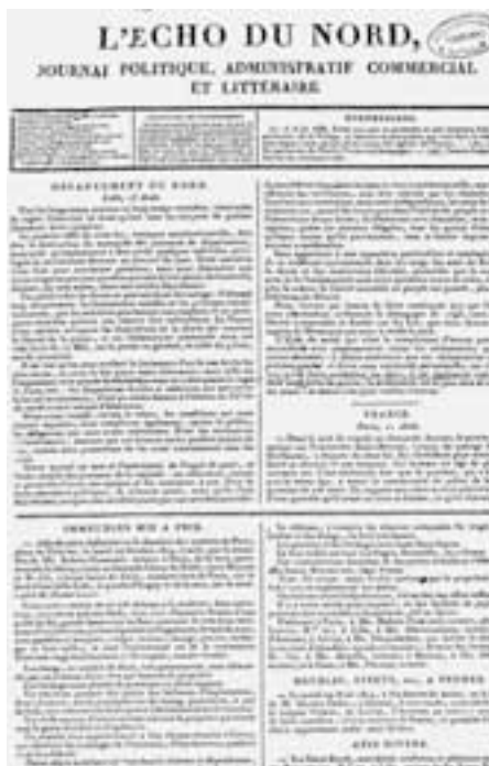
Le premier numéro de L'Écho du Nord est daté du 15 août 1819.

titre, la «une» s'ouvre sur les nouvelles du département, puis de la France. Le prix de l'abonnement mensuel est de 5 F par mois. Ce qui en restreint l'achat aux catégories les plus aisées.