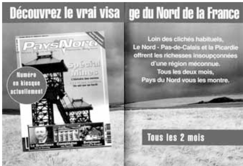
Publicité pour Pays du Nord en 1996 : « Découvrez le vrai visage du Nord de la France ».