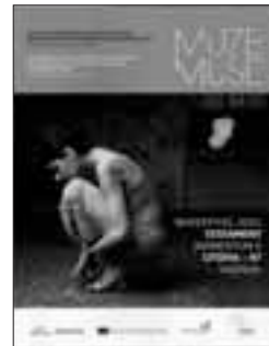
MuzeMuse. Magazine du réseau transfrontalier pour la promotion de la musique classique et contemporaine n° 1 février 2011.

Rien de plus sérieux que cette publication semestrielle, malgré son titre. En octobre 2010, trois organisations culturelles du Nord-Pas-de-Calais (l'Opéra de Lille, le Théâtre d'Arras et l'Orchestre national de Lille) et quatre de la Flandre occidentale (le Concertgebouw Brugge, le Festival van Vlaanderen Kortrijk, le MAfestival Brugge et le Cultuurcentrum Kortrijk), créaient MuzeMuse, un réseau transfrontalier pour la promotion et le développement de la musique classique et contemporaine.