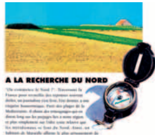
L'édito du premier numéro, «À la recherche du Nord», avec la boussole, symbole des débuts du journal.

vraiment que des Auvergnats pour faire des choses pareilles », ironisa le petit monde de la presse nordiste.