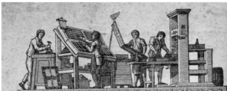
Vignette représentant un atelier d'imprimeur dans les premières années du XIX e siècle.