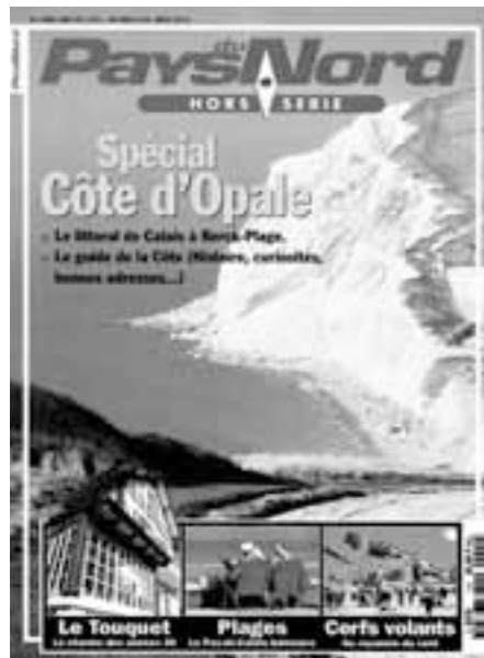
Le premier hors-série est consacré à la Côte d'Opale.

dépassé, les numéros suivants confirmèrent ce succès, pourtant beaucoup persistaient à croire que c'était fini, qu'un magazine comme celui-là ne pouvait pas survivre. Pendant un an, on me demanda régulièrement ce que je pensais faire après, autrement dit quand le journal aurait mis la clé sous la porte. Les annonceurs nous ignoraient. Normédia n'arrivait pas à vendre les espaces publicitaires. Quand on feuilleta les numéros parus en 1994 et en 1995, on est surpris par le décalage entre le contenu rédactionnel (belles photos, enquêtes variées, papier glacé) et des pubs dignes d'un gratuit de petites annonces (un magasin d'aquariums, une boutique de sacs à main, une agence matrimoniale, un fabricant de portes de garage, une voyante...). Ce curieux mélange cessa au bout d'un an, avec la sortie d'un numéro spécial consacré à la Côte d'Opale. Nous avons confié la régie pub de ce hors-série estival à une jeune commerciale tourquennoise. Avec ses méthodes peu conformistes et à grands coups de bluff, elle réussit à convaincre le monde du tou-