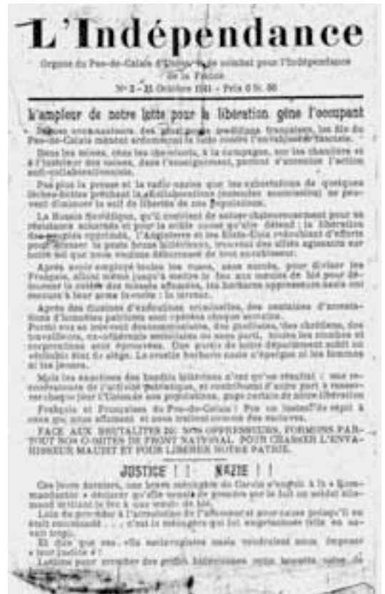
Le deuxième numéro de L'Indépendance sorti en octobre 1941.

violent, assassinent et sèment la terreur à travers le département ». On salue ensuite « la formation du comité départemental puis des comités locaux de Front national de lutte pour l'indépendance de la France ». Comités qui pourront compter sur l'aide et l'appui de tous les Français, à l'exception des traîtres « Kollaborateurs » qui devront « rendre des comptes ». Un article met en relief « la lutte des populations du Pas-de-Calais contre l'occupant », tout particulièrement la grève des mineurs de juin 1941. On y incite les paysans à « rouler » les commissions de ravitaillement, pour vendre directement aux Français : « C'est autant de moins pour Hitler ». On donne l'exemple de nombreuses locomotives en réparation : « C'est autant de moins pour Hitler ». On souligne l'attitude courageuse de patrons ayant permis à des ouvriers recherchés par la Gestapo de s'enfuir, de maires ou d'employés de mairie ayant refusé de dénoncer les commu-