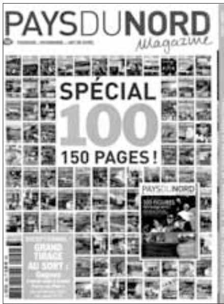
Le n° 100, paru en mars 2011, proposait une rétrospective du magazine depuis sa création.